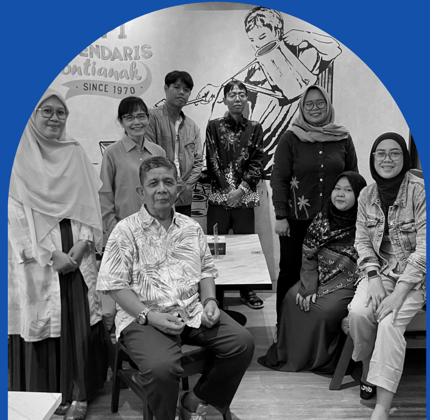
INTERVIEW TATAP MUKA PERTAMA